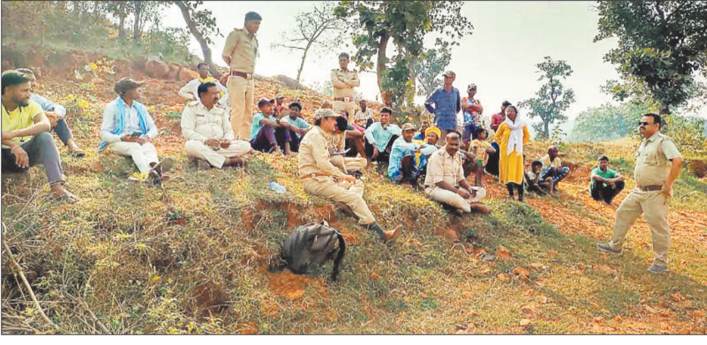
ग्रामीणों से चर्चा करते वन अमला की टीम।

खास बात वन भूमि पर बेजा कब्जा कर बना रहे थे पक्का मकान