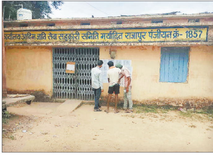
वीरान सहकारी समिति।

सहकारी समिति के कर्मचारियों के अनिश्चित कालीन हड़ताल पर जाने से समिति में ताला लटक रहा है। शासन ने 15 नवम्बर से सहकारी समितियों के माध्यम से धान खरीदी प्रारंभ करने की घोषणा कर दी है। इधर समिति के कर्मचारी अपनी मांगों पूरी होने के बाद ही कार्यस्थल पर लौटने की बात पर अड़े हैं। ऐसे में निर्धारित तिथि से धान खरीदी करना प्रशासन के लिए बड़ी चुनौती बन गई है। सहकारी समितियों में कार्यरत प्रबंधक, कम्प्यूटर ऑपरेटर, लेखापाल विक्रेता आदि अपनी मांगों के समर्थन में अनिश्चितकालीन हड़ताल पर हैं तथा लगातार धरना-प्रदर्शन कर रहे हैं। हड़ताली कर्मचारियों का कहना है कि प्रशासन नोडल अधिकारियों की निगरानी में धान की खरीदी कराता है। खरीदी पूरी होने के बाद नोडल अधिकारियों की ड्यूटी खत्म हो जाती है। नमीयुक्त धान की खरीदी होने के कारण भारी मात्रा में सूखत आती है जिसकी भरपाई समिति प्रबंधकों से की जाती है। सूखत की वसूली धान खरीदी करने वाले नोडल अधिकारियों से भी होनी चाहिए। शासन द्वारा पूर्व में कम्प्यूटर ऑपरेटरों को 18420 रूपए मासिक भुगतान का आश्वासन दिया गया था। वर्तमान में शासन द्वारा ऑपरेटरों की नियुक्ति आउटसोर्सिंग से करने एवं 6 महीना का वेतन भुगतान करने का निर्णय लिया गया है। समितियों में सेवा नियम लागू होना चाहिए तथा कर्मचारियों को सभी शासकीय सुविधाएं मिलनी चाहिए। पूर्व शासन द्वारा 72 घंटे के भीतर खरीदे गए