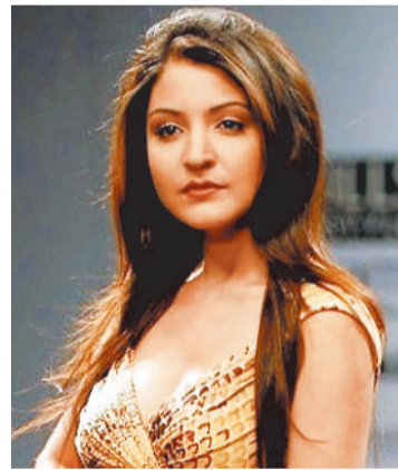
सलमान, शाहरुख और आमिर के साथ थीं फिल्में - साल 2010 में एक्ट्रेस रजनीश शर्मा की फिल्म बंड बाबा भारत में रणवीर सिंह के साथ नजर आये हैं। अनुष्का और रणवीर की केमिस्ट्री को फिल्म में काफी पसंद किया गया और दूसरी ही

मुंबई। साल 2018 में आई 'जिरो' के बाद बड़े पर्दे से दूर रही अनुष्का की बहुप्रतीक्षित फिल्म 'चकदा एक्सप्रेस' एक बार फिर चर्चा में आ गई है। दिग्दर्शक खबर है कि निर्माताओं ने भारतीय महिला क्रिकेट टीम की ऐतिहासिक जीत के बाद नेटफ्लिक्स के शीर्ष अधिकारियों को पत्र लिखकर फिल्म रिलीज करने की गुंजाइश की है। उनका कहना है कि इल्लुम गोस्वामी जैसी महान खिलाड़ी पर कनी ये बायोपिक दर्शकों तक पहुंचनी चाहिए और किसी विवाद या अड़चन से ऊपर उठकर फिल्म को रिलीज किया जाना चाहिए। हॉलीवुड की वो खूबसूरत अदाकारा जिसकी पहली ही फिल्म बॉक्स-ऑफिस पर ब्लॉकबस्टर रही थी। एक्ट्रेस ने शाहरुख खान के साथ फिल्मों पर कई कदम रखा था। इस हस्तीना के कैरियर की पहली ही फिल्म यशराज बैनर्स तले बनी थी जो बड़ी-बड़ी एक्ट्रेस का ख्याल होता है। एक्टिंग के बाद उन्होंने प्रोड्यूसन में किस्मत आगमई और वहां भी खूब सफलता हासिल की। लेकिन कैरियर के पीक पर हस्तीना ने शादी कर फिल्मों से लंबा बेक ले लिया और अब 7 साल बाद उनके कमबैक को लेकर चर्चा तेज हो गई है। अनुष्का और रणवीर सिंह के साथ नजर आये हैं। अनुष्का और रणवीर की केमिस्ट्री को फिल्म में काफी पसंद किया गया और दूसरी ही